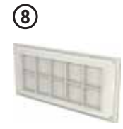
• Ek Priz Modülü 08