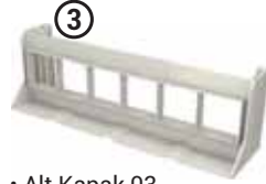
• Alt Kapak 03