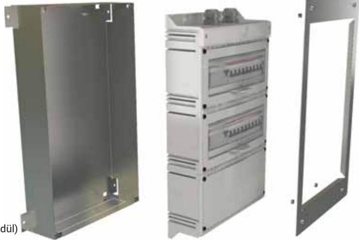
Multibox Sıva Altı Montaj Takımı (Üç Modül)