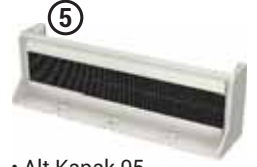
• Alt Kapak 05