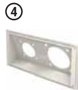
• Ek Priz Modülü 04