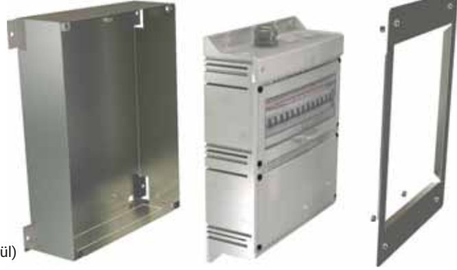
Multibox Sıva Altı Montaj Takımı (İki Modül)