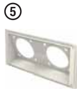
• Ek Priz Modülü 05