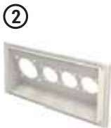
• Ek Priz Modülü 02