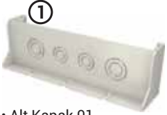
• Alt Kapak 01