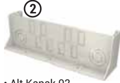
• Alt Kapak 02