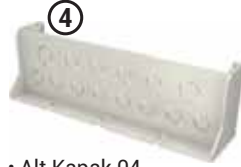
• Alt Kapak 04