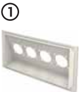
• Ek Priz Modülü 01