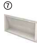
• Ek Priz Modülü 07