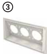
• Ek Priz Modülü 03