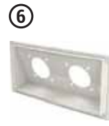
• Ek Priz Modülü 06