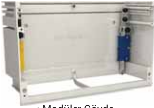
• Modüler Gövde